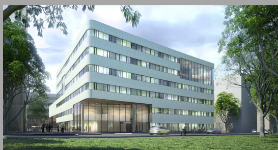
FIR e.V. an der RWTH Aachen