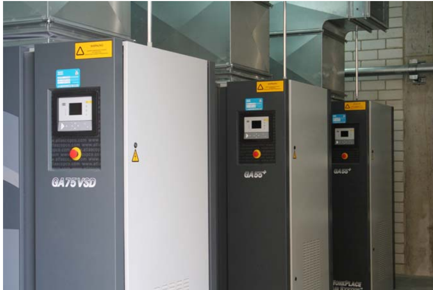
Drei energieeffiziente GA-Schrauben-Kompressoren verrichten in der neuen zentralen Druckluftstation bei Walhalla-Kalk ihren Dienst. Ganz vorne der GA 75 VSD mit Drehzahlregelung (Variable Speed Drive, VSD), dahinter zwei etwas kleinere GA 55 + .