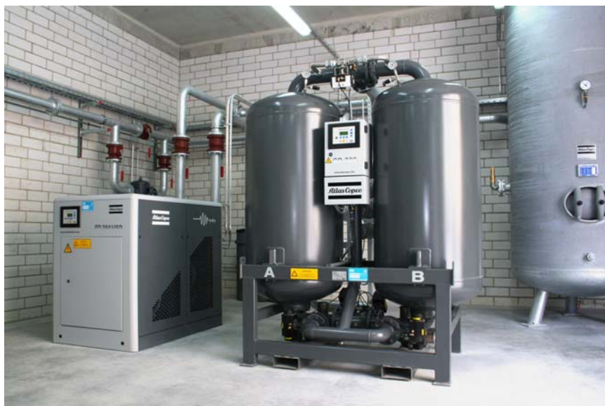
Drucklufttrocknung nach Jahreszeit: Während im Sommer ein sehr effizient arbeitender Kältetrockner des Typs FD 750 VSD ausreicht, stellt im Winter ein Adsorptionstrockner des Typs CD 780 mit Taupunktsteuerung einen Drucktaupunkt von bis zu -40 °C sicher.